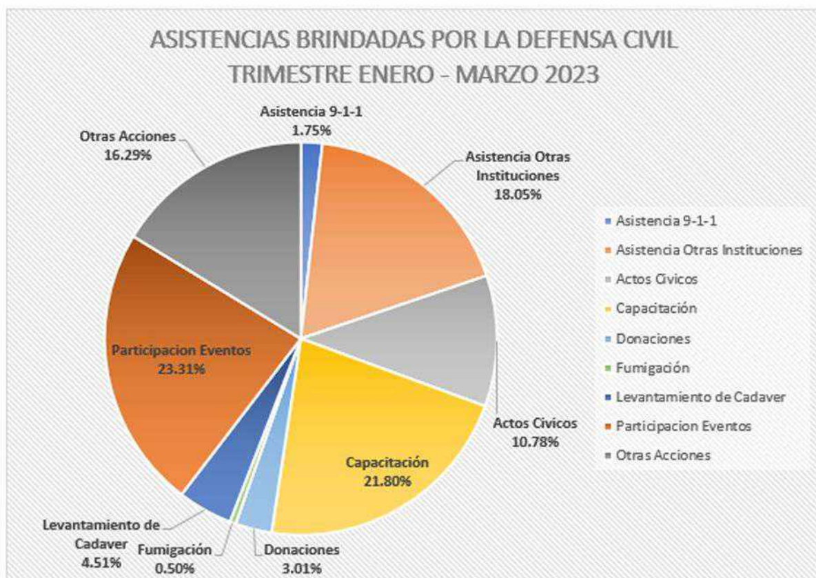
Ilustración 2. Acciones brindadas por la Defensa Civil primer trimestre 2023